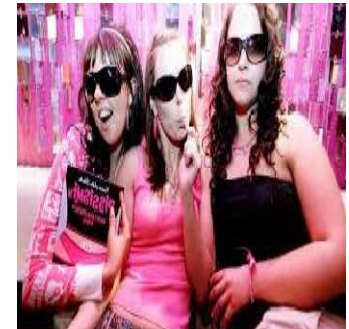
Pissikset, fruittarit, gootit, hevarit, tavikset ja hopparit